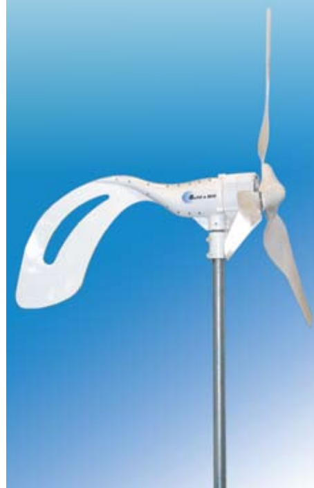
Husstandsvindmøllen er et af de bæredygtige tiltag, man må forvente at se flere af i de kommende år.